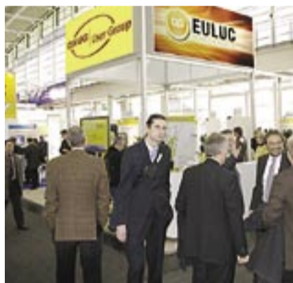
DNUG Pavillon, Halle 2, Stand F20

COMMON Deutschland und TOOLMAKER Software GmbH