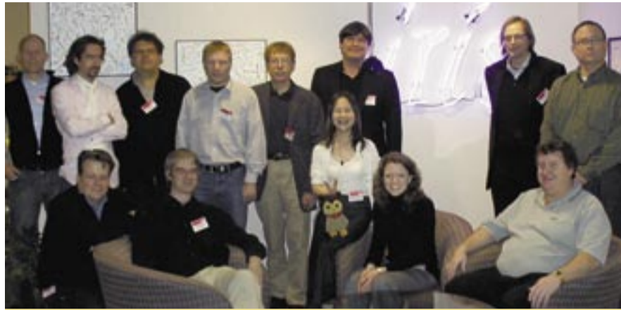
Die DNUG Delegation vor dem historischen Iris-Logo bei IBM Lotus in Westford

Unsere DNUG Gruppe traf sich nach individueller Anreise am Montag an der Rezeption und nach kurzem Hallo gingen wir gemeinsam die 110 Meter bis zum IBM Compound. Bei der nächsten LabTour sollen größere und speziell zu diesem Zwecke geplante Räumlichkeiten zur Verfügung stehen. Auf der IBM LabTour 2008 hat die Abkürzung „IBM“ für uns Teilnehmer eine neue Bedeutung erhalten: „Information Between Meals“: Selbst in den Kaffeepausen und beim Mittagessen wurden die Vorträge der Lotus Experten über die IBM Lotus Produkte und die Strategie fortgeführt.