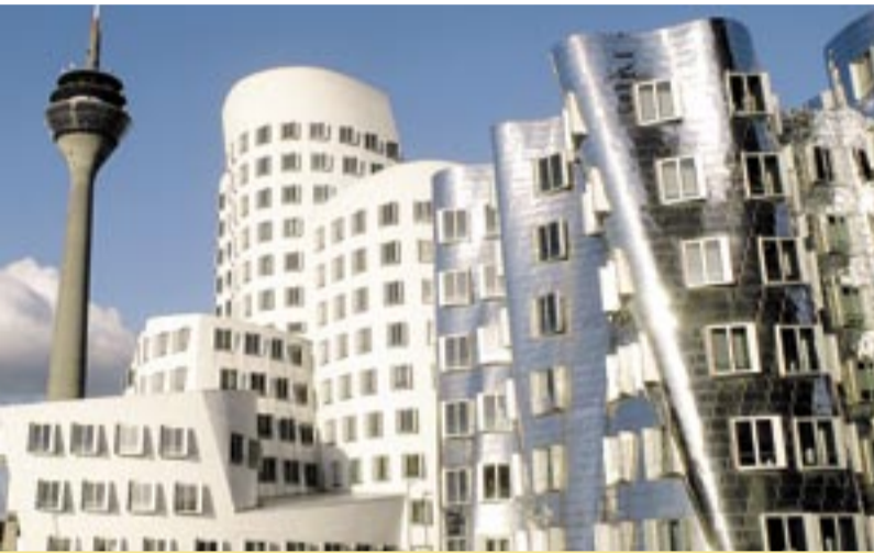
Impressionen aus Düsseldorf: der Medienhafen

Mehr Informationen dazu finden Sie auf http://dnug.de/conference