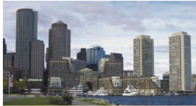
Ein Blick auf die Skyline von Boston

Ganz unterhaltsam fand ich den Beitrag, wie IBM durch eine beispielhafte Lizenzkostengegenüberstellung dem Hauptwettbewerb Microsoft aus Kostensicht entgegenzutreten will: Sehr häufig scheint Microsoft die Kunden mit kostengünstigeren Lizenzrechnungen locken zu wollen;