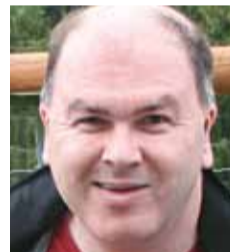
Heinrich Kroiss Raiffeisen Informatik GmbH

Unterm Strich überwog durchaus das Positive und ich kann einen Besuch in 2012 nur empfehlen.“