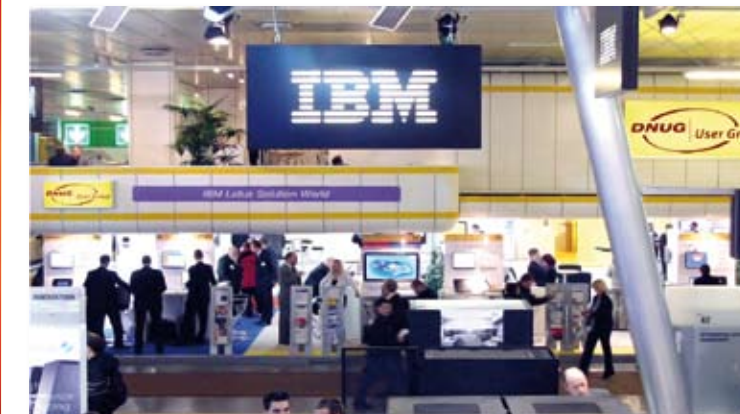
Der DNUG Pavillon in guter Nachbarschaft

senden Know-how der Experten von IBM und der IBM Partner sowie den praktischen Erfahrungen der DNUG Mitglieder und erhalten ein einzigartig umfassendes aber auch realistisches Bild von den Einsatzmöglichkeiten der IBM Middleware.“