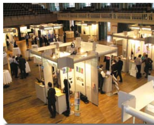
Präsentation der Aussteller

Ausrichtung der Herbstkonferenz richtig liegen“, sagt Reiner Gratzfeld, Vorstandsvorsitzender der DNUG. „Wir werden das Konzept mit weiteren Themen und Formen optimieren. Bewährtes mit Neuem zu verbinden ist zugleich das Ziel unserer Strategie DNUG 2010, an der wir seit diesem Jahr verstärkt arbeiten.“ Altes und Neues verband auch die Abendveranstaltung: Bei der Party in der gotischen Alten Bräuerkirche konnten Mitglieder und Konferenzbesucher bis in die Nacht hinein Erfahrungen und Eindrücke austauschen, bestehende Kontakte pflegen und neue Geschäftsbeziehungen knüpfen. „Alles in Allem war die Konferenz ein voller Erfolg. Lediglich der Zeitpunkt für das Release von Lotus Notes Version 8 blieb ein Geheimnis, das auch von Jeffrey Mann, Vice President der Gartner High Performance Workplace Group, nicht gelüftet werden konnte.“