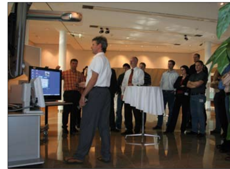
Zu Gast bei VR Kreditwerk Hamburg-Schwäbisch Hall

Erfahrungsaustausch in einer starken Community