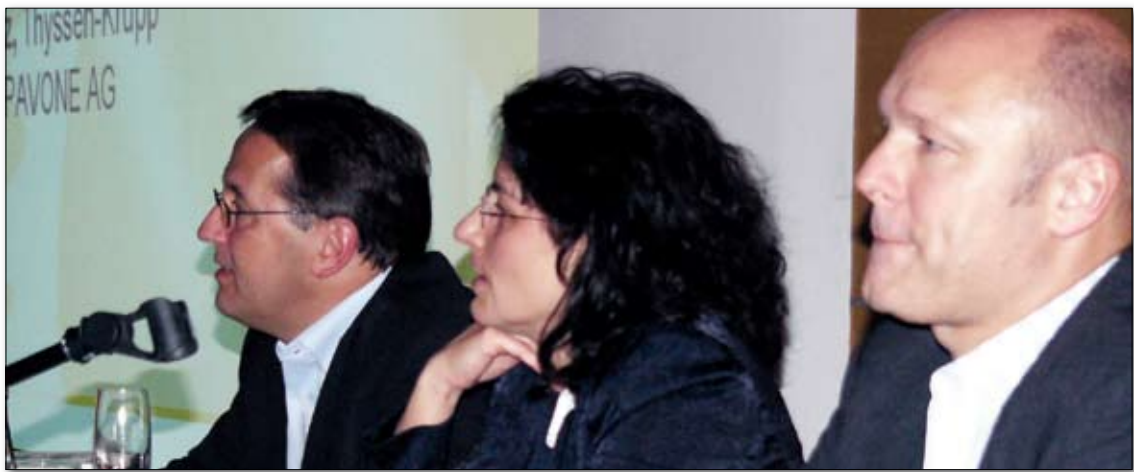
Der Vorstand der DNUG

Der Vorstand stellt seine Initiative vor