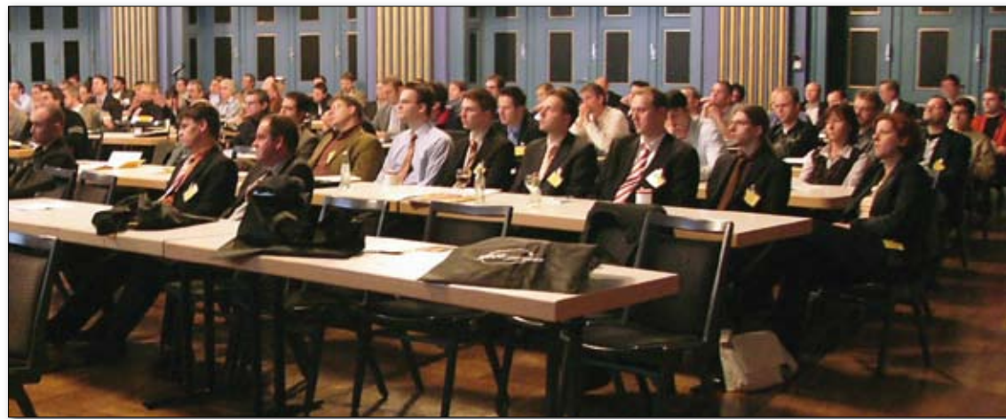
Interessante Vorträge rund um Lotus Notes

Die klassizistische Stadthalle des Kongress Palais Kassel bildet einen stilvollen Rahmen für die 25. Konferenz der DNUG. Zu diesem erneuten Jubiläum im November 2006 konnten vor allem technisch interessierte IT-Profis nach Kassel gelockt werden. Bei den 350 Teilnehmern war der Bedarf an Informationen über die nächste Version von Notes sehr groß.