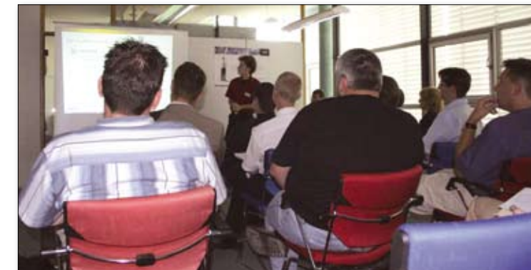
Regionalworkshop Stuttgart „IBM Portal-Software“

Um ein näheres Kennenlernen und einen interessanten Erfahrungsaustausch zu ermöglichen, bietet die DNUG regelmäßige Treffen ihrer Mitglieder in verschiedenen Regionen Deutschlands an. Die Veranstaltungen beginnen meist im Laufe des Nachmittags, um vielen Nachfragenden die Teilnahme zu ermöglichen. In der Regel ist jeweils ein Fachvortrag im Programm, der in den Diskussionsteil überleitet. Ein kulturelles Angebot danach oder als Auftakt rundet die Agenda ab.