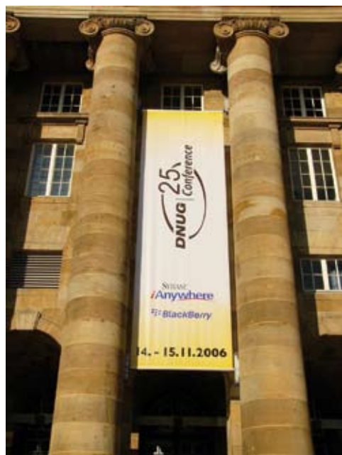
Kongress Palais Kassel-Stadthalle

Die klassizistische Stadthalle des Kongress Palais Kassel bildet einen stilvollen Rahmen für die 25. Konferenz der DNUG. Zu diesem erneuten Jubiläum im November 2006 konnten vor allem technisch interessierte IT-Profis nach Kassel gelockt werden. Bei den 350 Teilnehmern war der Bedarf an Informationen über die nächste Version von Notes sehr groß.