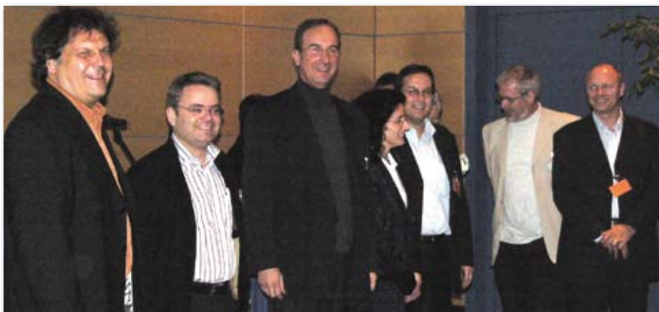
Mit neuen Ideen in die Zukunft

So ist z.B. eine der sich abzeichnenden Anforderungen, den Erfahrungsaustausch zwischen den Mitgliedern zu stärken und hierzu Angebote zu schaffen. Bereits anlässlich