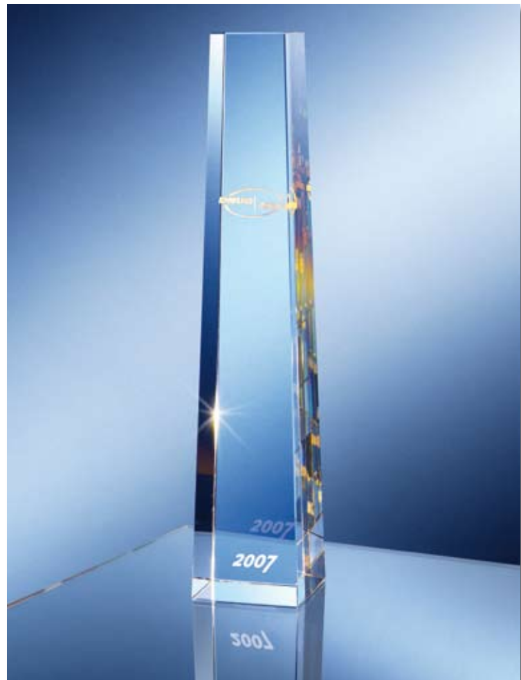
Die begehrte Trophäe

Die diesjährige Verleihung der in der Branche hoch angesehenen Auszeichnung wird im Rahmen unserer Frühjahrskonferenz in Dresden stattfinden. Nutzen Sie die Gelegenheit und melden Sie sich bis zum 31. März 2007 auf unserer Website mit