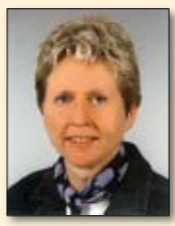
Liebe Leserinnen und Leser,

„Hannover“ goes Dresden - und macht die Elbmetropole drei Tage lang zur Hochburg für Collaboration Software. Notes/Domino 8, Connections, Quickr, Sametime sind die Stars in der Konferenzagenda und im Expert's Lab; die zukünftigen Stars der Manege sind es im Programm der Abendveranstaltung! In den letzten Wochen haben sich viele weitere Bausteine zu dem bunten Mosaik gefügt, das wir Ihnen im Juni anbieten. Gemeinsam mit unseren Partnern in der Ausstellung, den Referenten der Anwenderberichte und dem Team der IBM sind wir uns auch dieses Mal sicher, damit den Nerv der Zeit und Ihre Erwartungen getroffen zu haben. Versäumen Sie nicht dabei zu sein - wir freuen uns auf Sie! In den aktuellen News lesen Sie außerdem ein Interview mit dem Vorstand zum Strategieprojekt DNUG 2010, erfahren, wer in den letzten Wochen Mitglied geworden ist, und erhalten Hinweise zur Beteiligung am Diplomarbeiten Wettbewerb 2007.